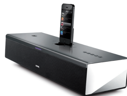
iPhone nicht im Lieferumfang enthalten.

SoundPort Compact, Netzkabel, Audiokabel (3,5 mm Klinke), USB-Kabel (Typ A-B), Bedienungsanleitung B 41,9 / H 10,9 / TP 17,8